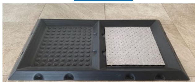
Tapete Sanitizante 2 Pasos

PASO 1 Cavidad para liquido o tapete desinfectante